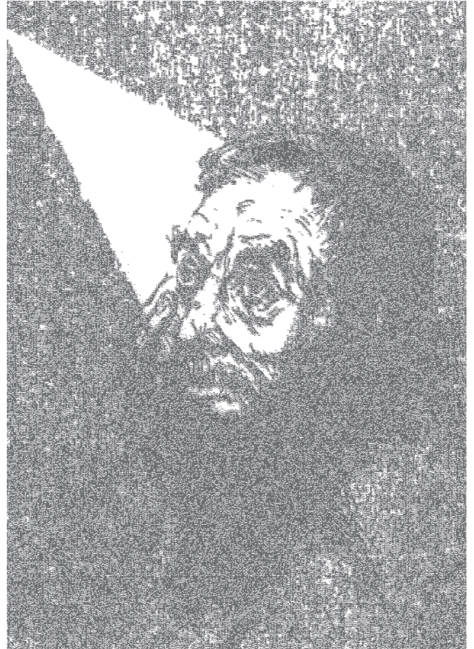
Marcel Häflinger: Amos, aus: W. Bühlmann/A. Schwegler: Impulse zum Bibel- und Religionsunterricht. Der Prophet Amos, © rex Verlag, Luzern 1990